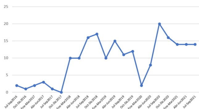
Figura 2. Tendencia del diagnóstico al debut de cáncer de pulmón según trimestre.

finales del 2019, al inicio de pandemia por COVID-19 (primer trimestre del 2020) los diagnósticos al debut disminuyeron, pero esto fue incrementando en el transcurso del tiempo (figura 2).