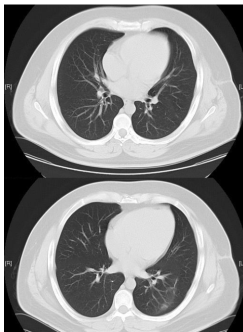
Figura N° 1B

Tomografía axial computarizada con contraste